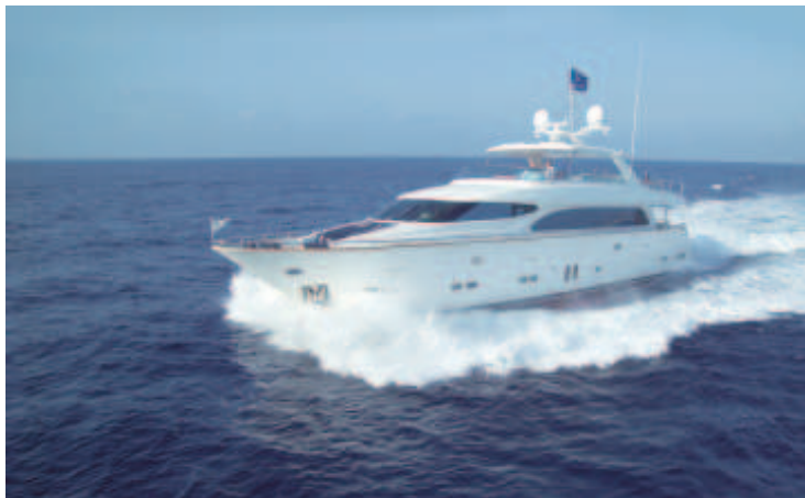
Der Markt für Luxusyachten ist in einem gewaltigen Umbruch.

Aber nicht nur die klassischen Superlative wie größer oder breiter sind bei den Elegance Yachten gefragt. Auch auf die Ausstattung der Yachten wird ein großes Augenmerk gelegt und so kann sich jeder Elegance-Kunde bei seiner neuen Yacht individuell sein Interieur einrichten und bauen lassen. Dieser Luxus besitzt einen enormen emotionalen Stellen-