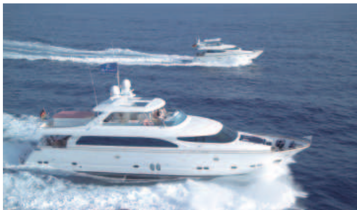
Auf den Balearen bemerkt man derzeit einen Ansturm auf Luxusyachten.